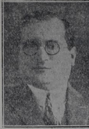
AGUSTIN DE ARRIETA

Mar del Plata y Bahía Blanca se ha manifestado, si no con tanto vigor, discretamente, en los demás pueblos. Tandil, por caso, no obstante la enconada disputa entre los rivales conservador y radical, que llevó a las urnas más de seis mil sufragios, dió al Partido Socialista 290 votos contra 155 en la elección similar de 1927. Olavarría, con sus núcleos de población obrera, donde los compañeros realizan una acción inteligente y bienhechora, ha dado al Partido Socialista 376 votos contra 268 en 1927, alcanzado una cifra promisoramente mayores.